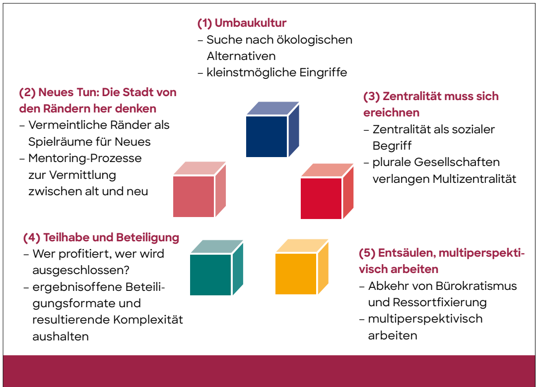
Abb. 2: Ergebnisse der Bremer Universitätsgespräche (BUG): Bausteine einer Stadtentwicklungspraxis jenseits von Zentrum und Peripherie (eigene Darstellung)

Praktiken, Interaktionen und Begegnungen. So verhindere die verbreitete „Marktplatzfixiertheit“ des stadtentwicklungspolitischen Diskurses die Schaffung ergebnisoffener Freiräume, in denen Zentralität vor allem als sozialer Begriff verstanden werden könne. Gleichzeitig wurden auch kritische Stimmen zum Zentralitätsbegriff laut: Zentralität würde insofern überschätzt, als „jeder Ort (...) zentral sein“ könne. Außerdem werde Zentralität oft „zu europäisch gedacht“ und im Horizont von Prestige und Disktinktion begriffen. Demgegenüber gelte es, die „Stadt für alle“ zu denken: Eine plurale Ge-