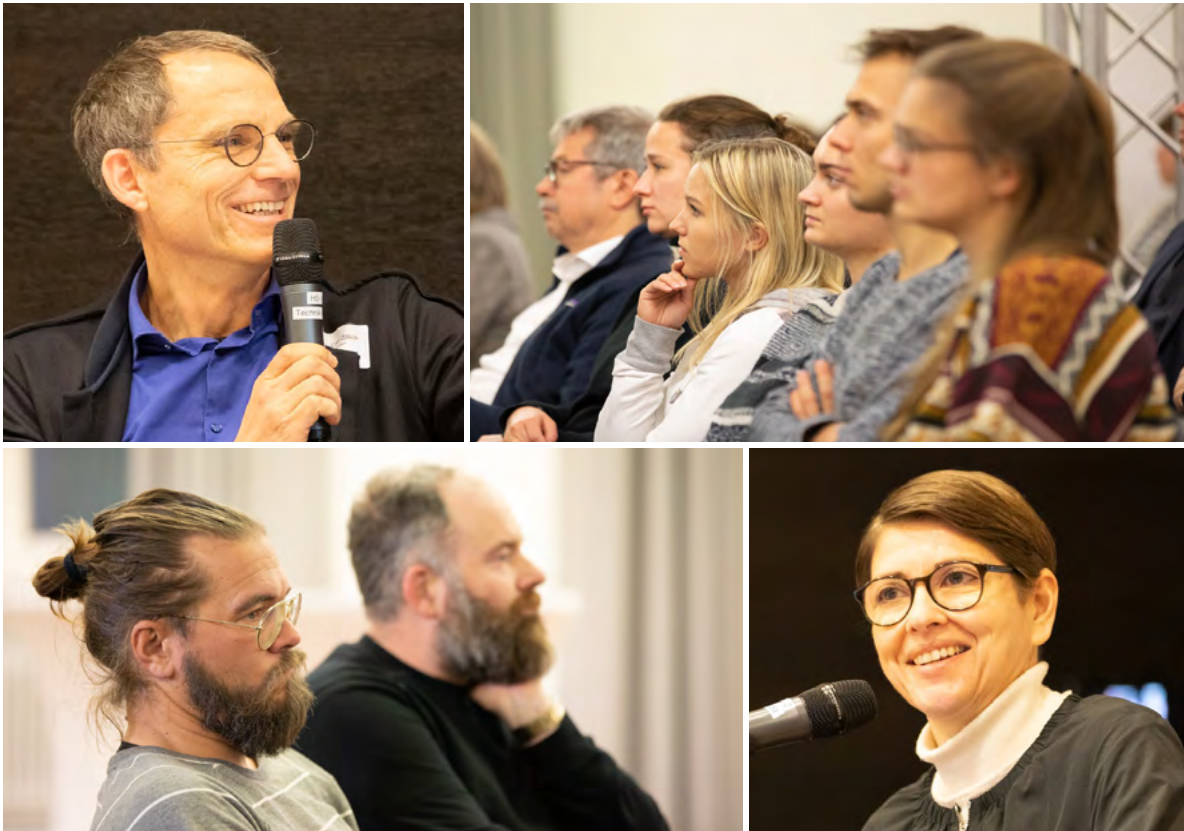
Abb. 1: Die 34. Bremer Universitätsgespräche