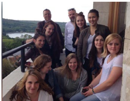
Die deutschen Studentinnen verbrachten eine spannende Zeit in Moldawien.

Terminkalender voller Vorfreude vollgekrizelt: „Die Moldawierinnen kommen!“ In großen, bunten Buchstaben und mit einem riesigen Lächeln im Gesicht. Und es hat sich gelohnt“, berichtet Denise Hasselbrink, Studentin der Medien- und Kommunikationswissenschaft im 8. Semester an der Universität Bremen, die an dem Austausch-Projekt teilgenommen