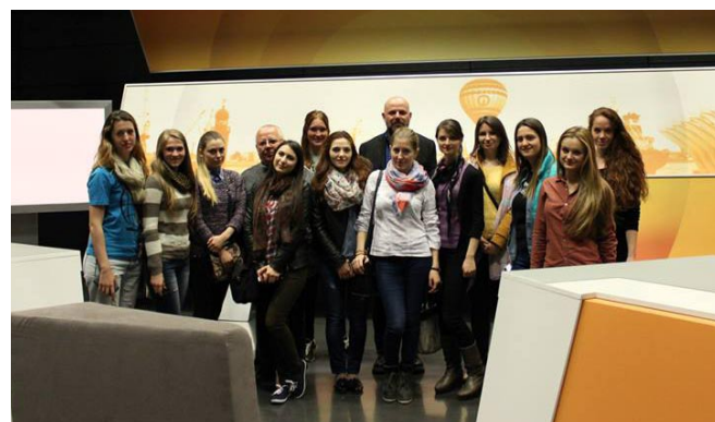
Die moldawischen Austauschstudentinnen zu Gast bei Radio Bremen.

Im Anschluss an die Woche in Bremen fuhren 9 Studentinnen der Universität Bremen nach Moldawien um das dortige Leben kennenzulernen. Die Studierenden besuchten vor Ort unter anderem einen öffentlich rechtlichen Radiosender, sowie ein privat geführten TV-Sender. Und auch der Partneruniversität wurde ein Besuch abgestattet. „Sie zeigten uns ihr Leben, ihre Kultur und ihre Gastfreundlichkeit. Sie sind uns