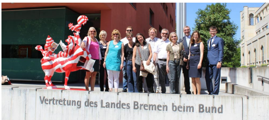
Die Alumni vor der Vertretung des Landes Bremen im Berliner Diplomatenviertel.

Im Anschluss ging es weiter zum Bundestag: Die Besichtigung der Kuppel des Reichstags-