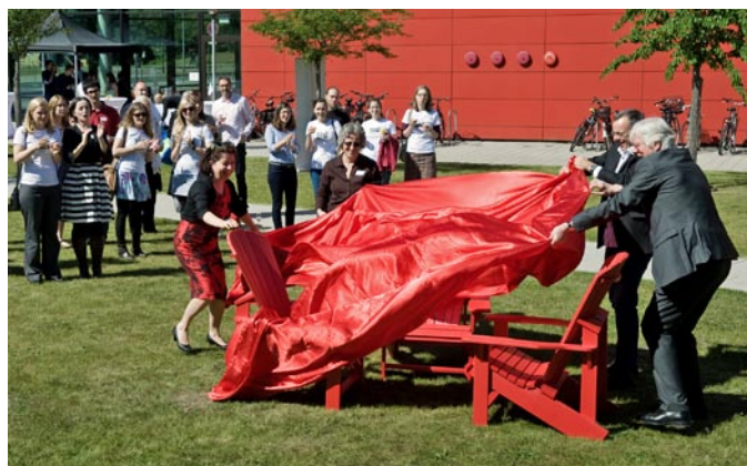
Die feierliche Enthüllung der roten Stühle.

So zögerten beide auch nicht, als die Bitte an sie herangetragen wurde, den Kauf von „Dickinson Chairs“ zu unterstützen. Diese roten Stühle schmücken schon lange und in großer Anzahl den Campus des Dickinson College. Die Idee, die gleichen Stühle als Zeichen der Zusammengehörigkeit auch auf dem Bremer Campus aufzustellen, entstand beim letzten Besuch