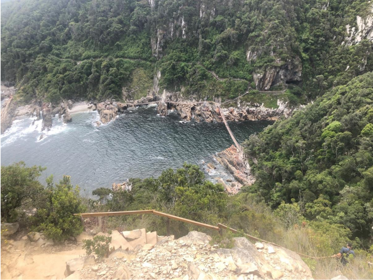
Tsitsikamma Nationalpark (Garden Route)