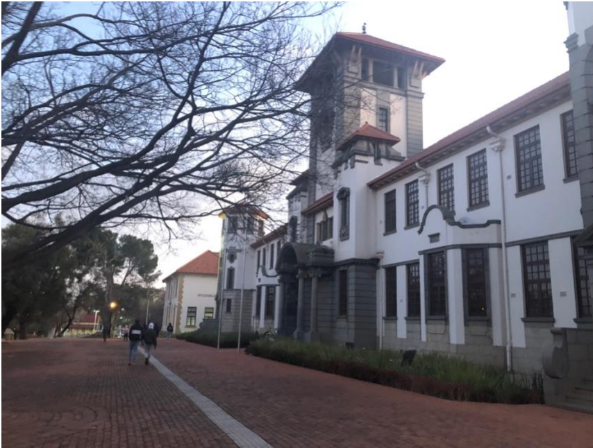
UFS - Main Building