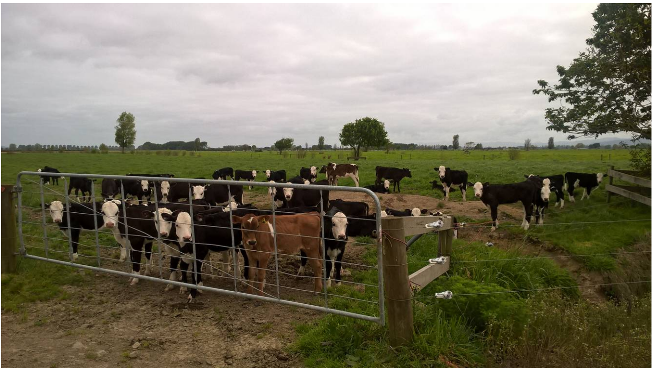
Abb. 6: Exkursion aufm Land im Waikato District. Mit 2 Doktoranden habe ich Wasserproben genommen.