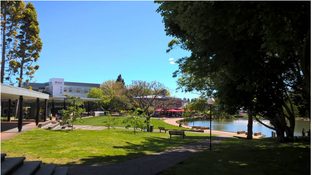
Abb. 2: Campus der Waikato University.