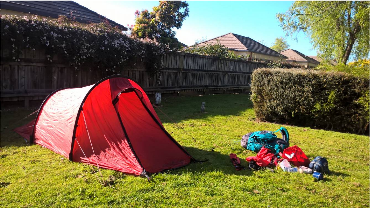
Abb. 3: Zwischenzeitliche Unterkunft, Holiday Park Hamilton.