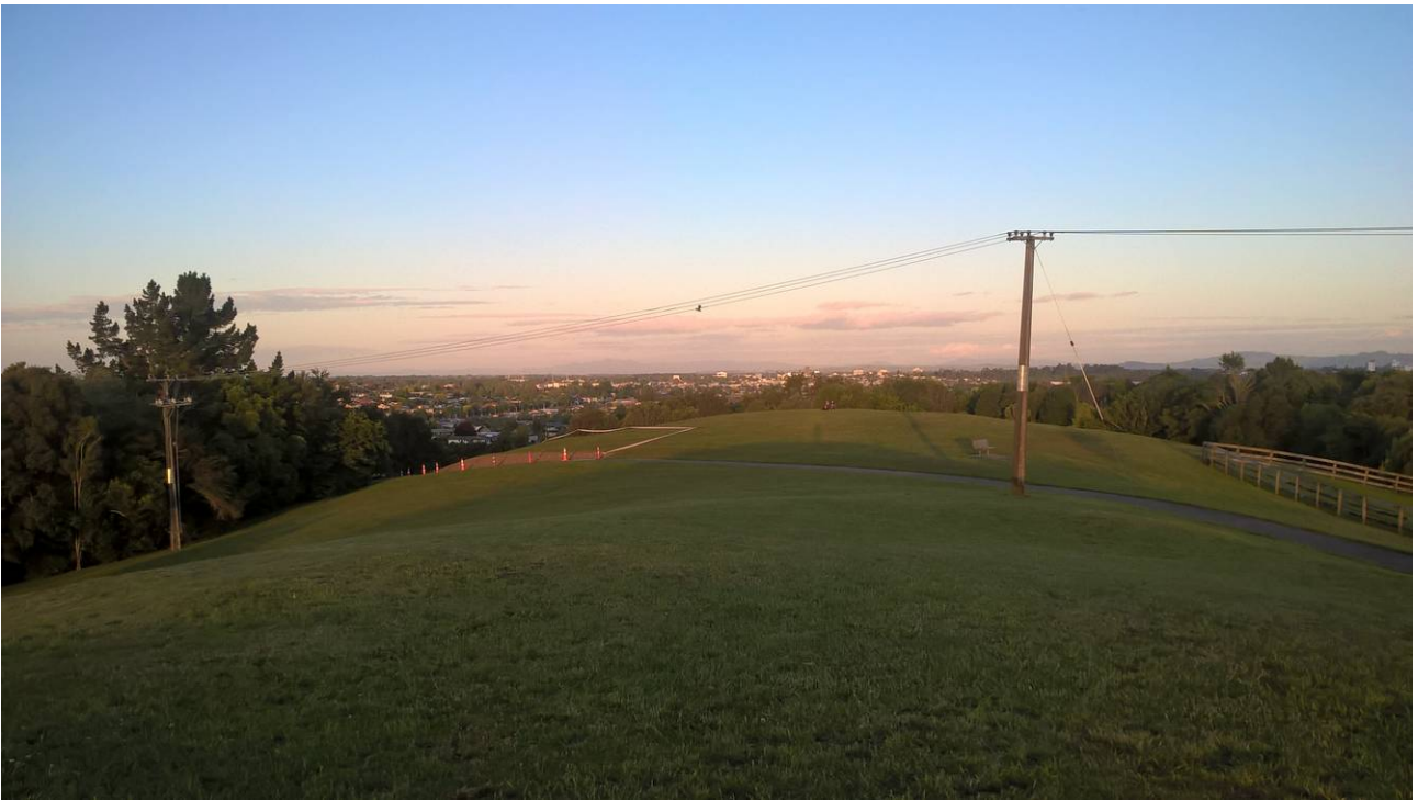
Abb. 1: Blick auf Hamilton, Neuseeland.