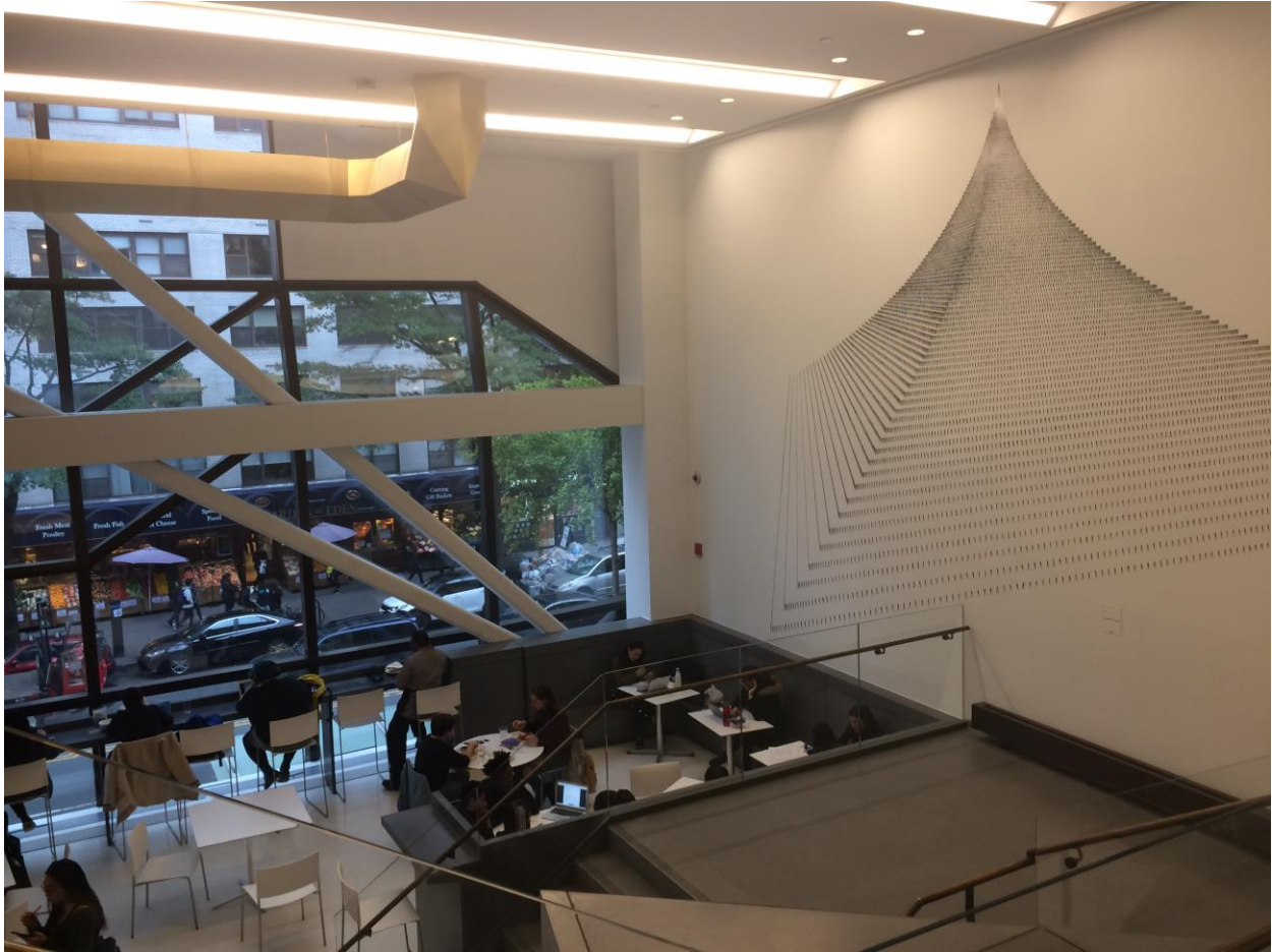
63 Fifth Avenue – New School University Center