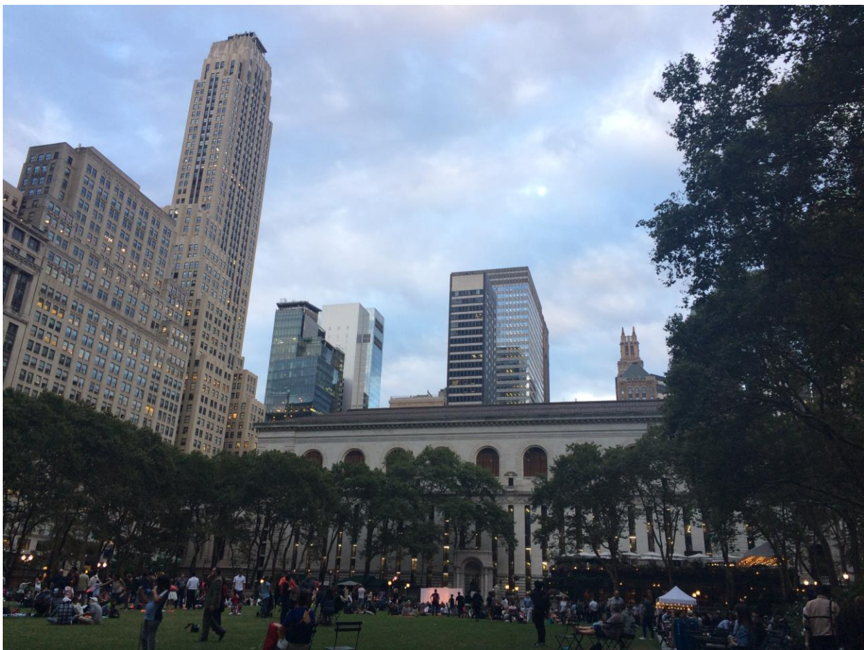
Einer meiner Lieblingsorte: Bryant Park

Und abschließend folgen ein paar visuelle Eindrücke