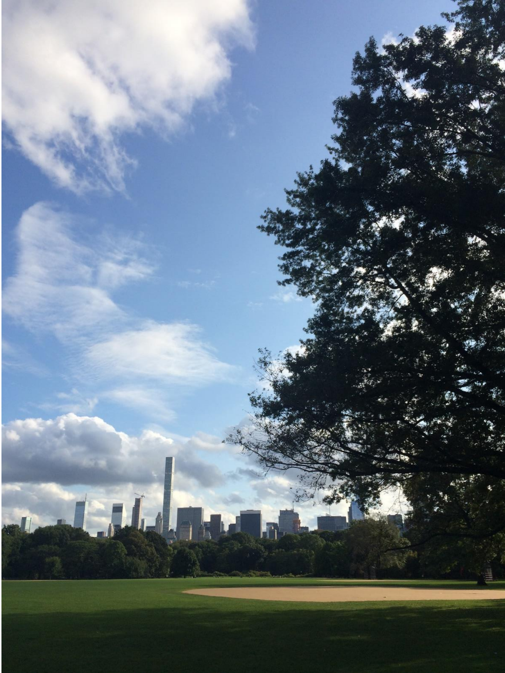
Ausblick vom Central Park in die City