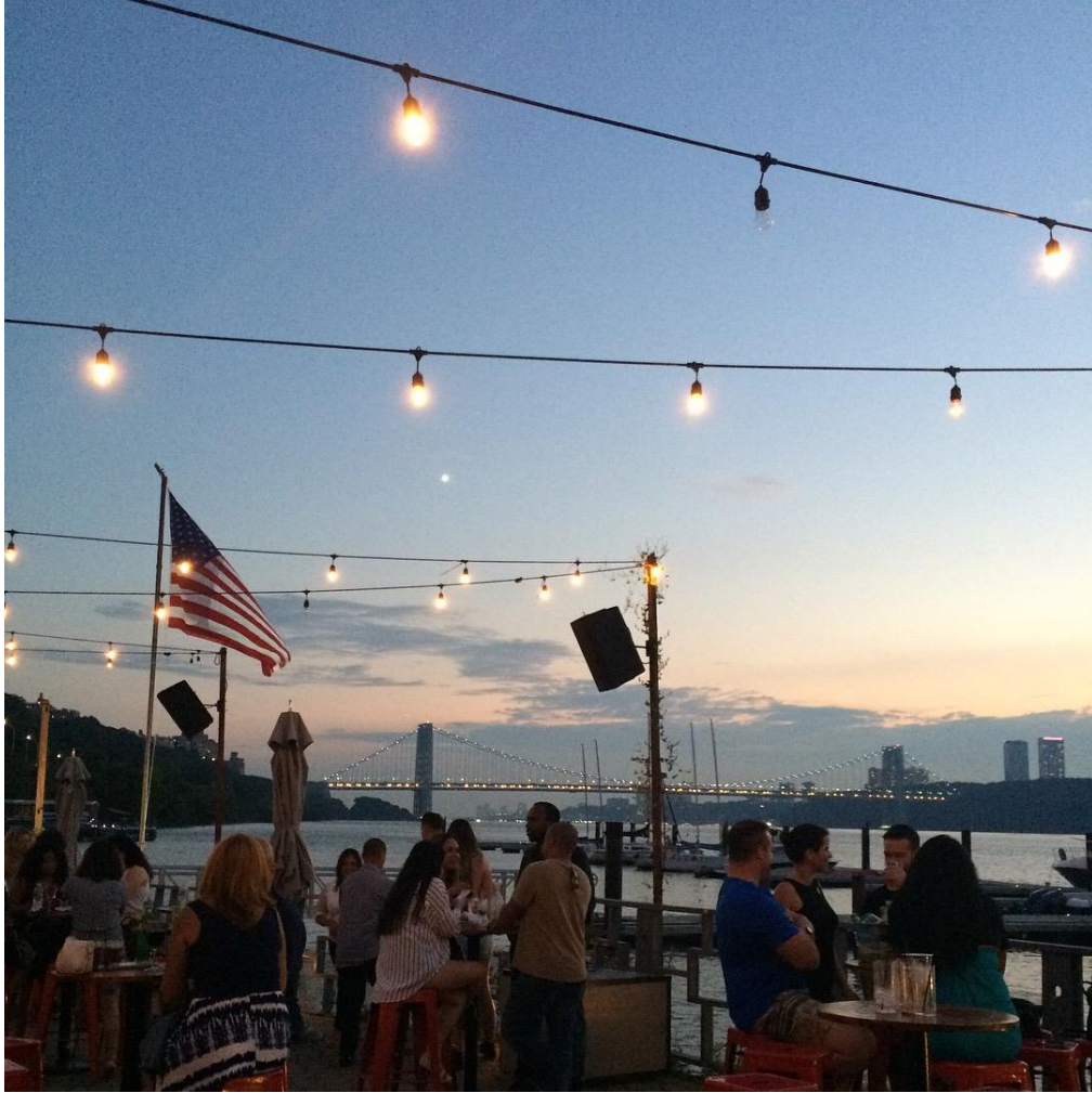
La Marina Restaurant Bar