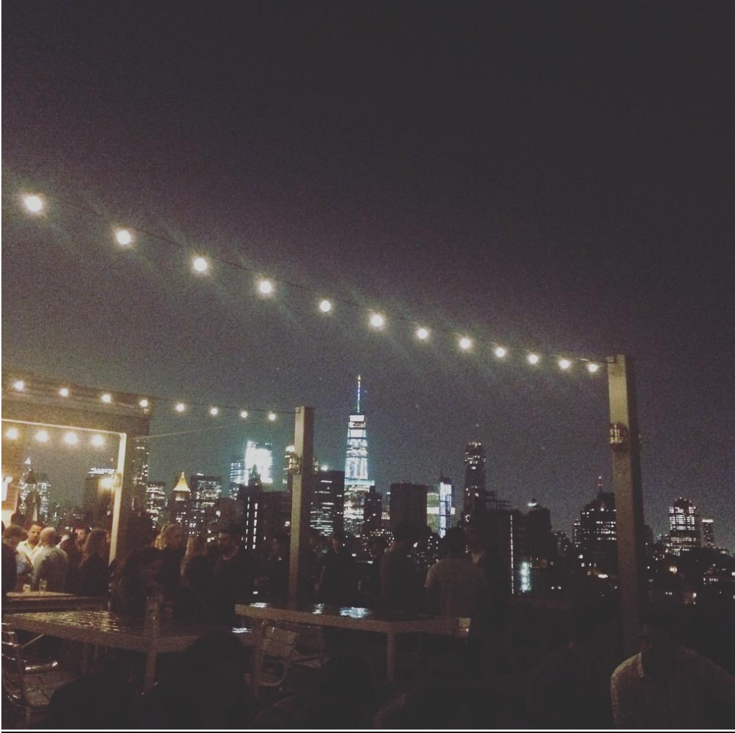
Mr. Purple Rooftop