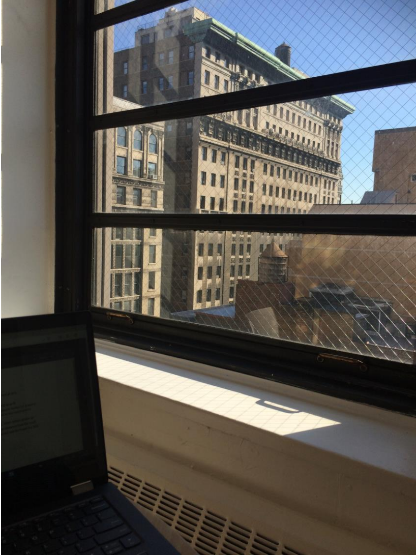
Im NSSR Building