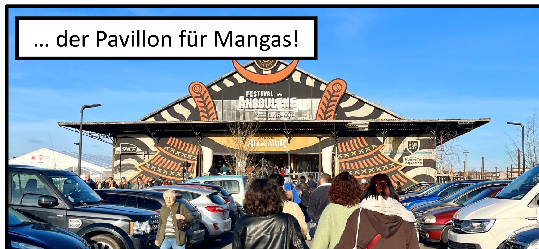
... der Pavillon für Mangas!