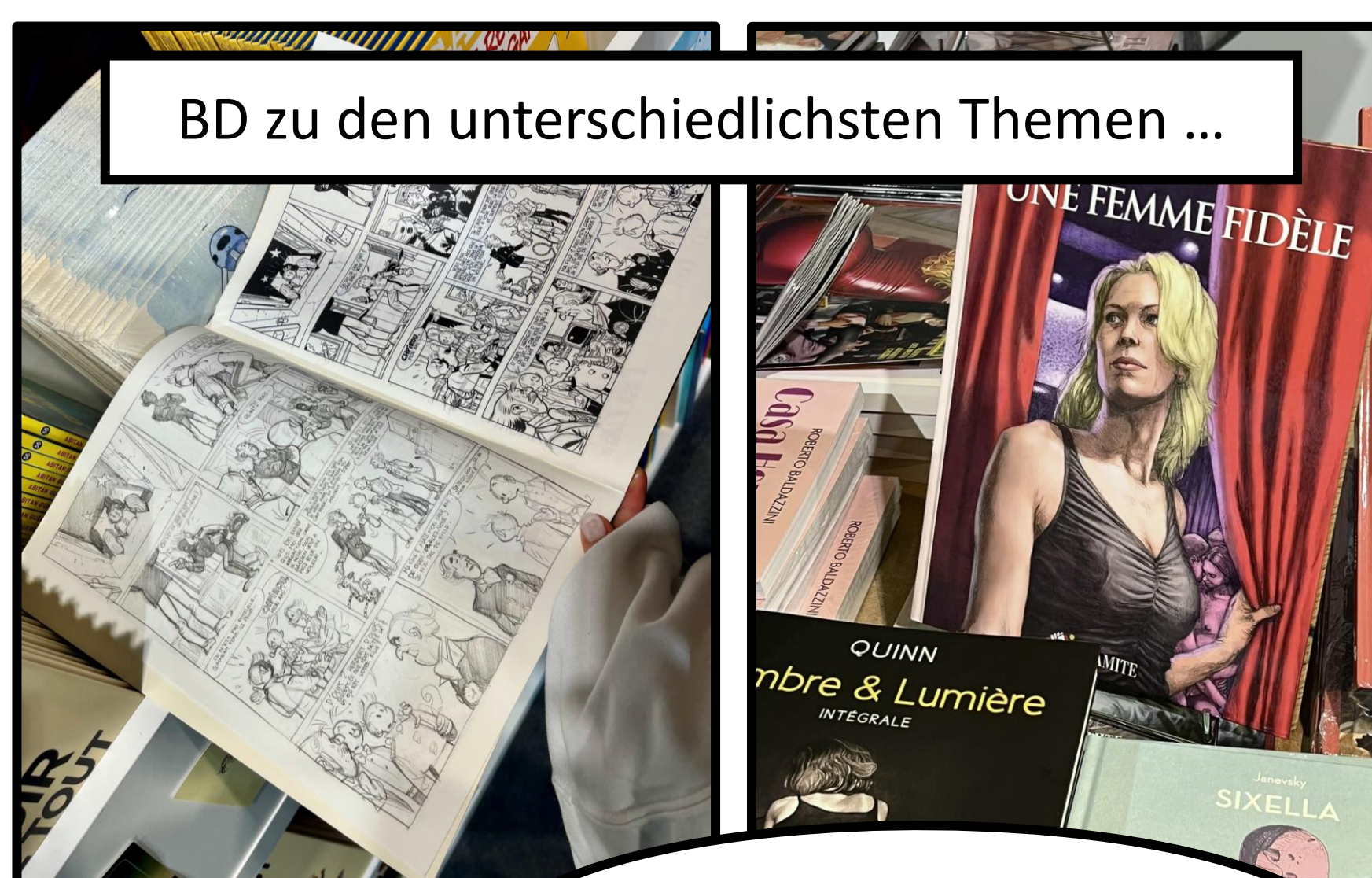
BD zu den unterschiedlichsten Themen ...