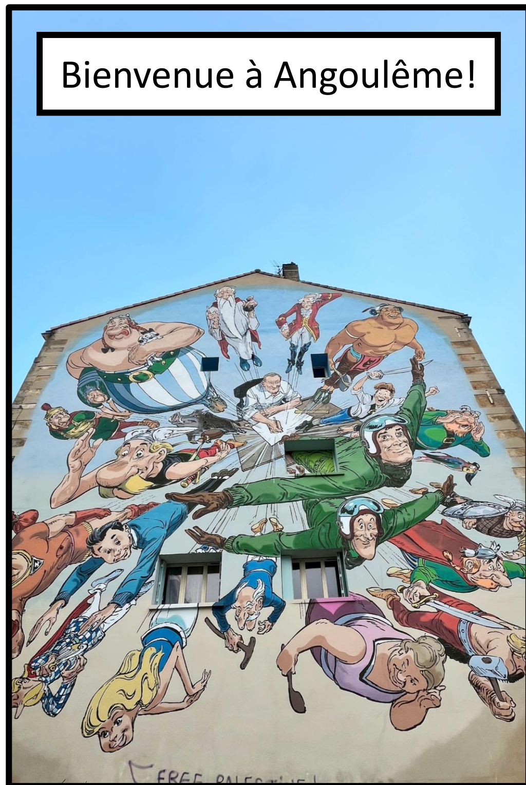
Bienvenue à Angoulême!