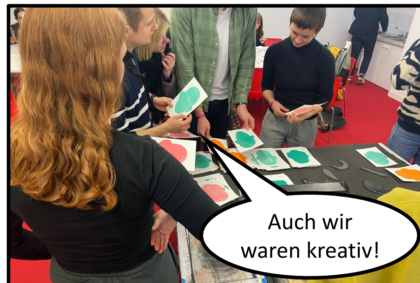
Auch wir waren kreativ!