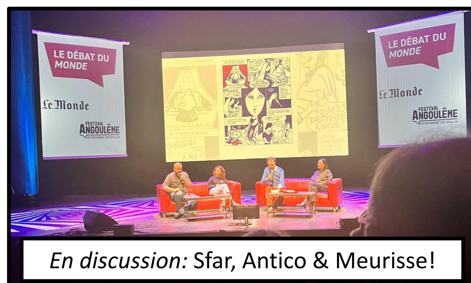
En discussion: Sfar, Antico & Meurisse!