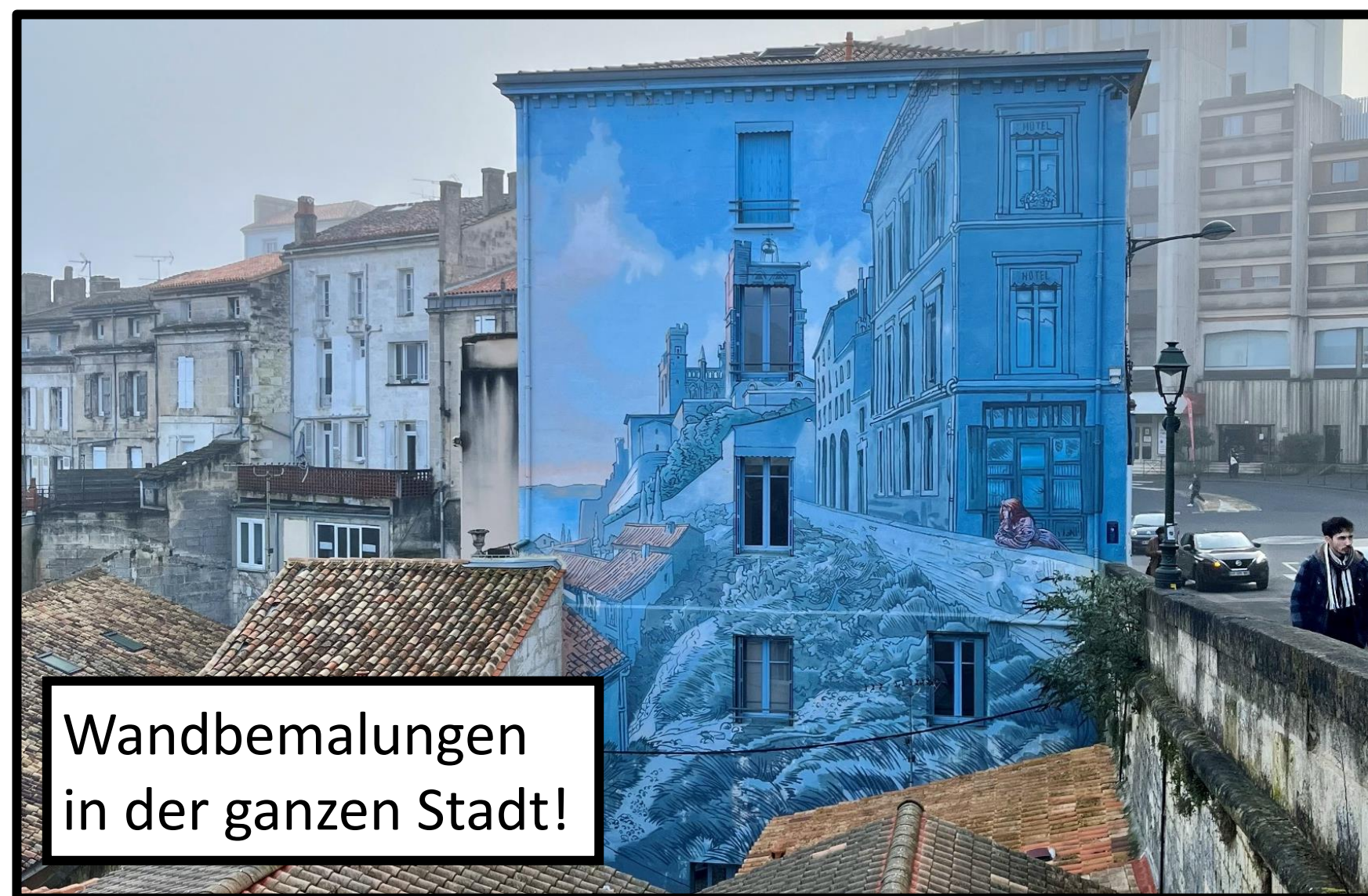
Wandbemalungen in der ganzen Stadt!