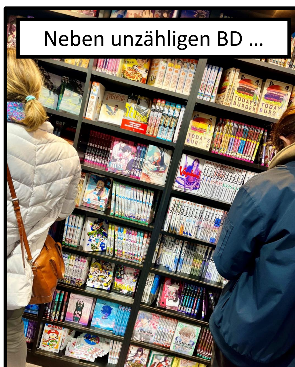
Neben unzähligen BD ...