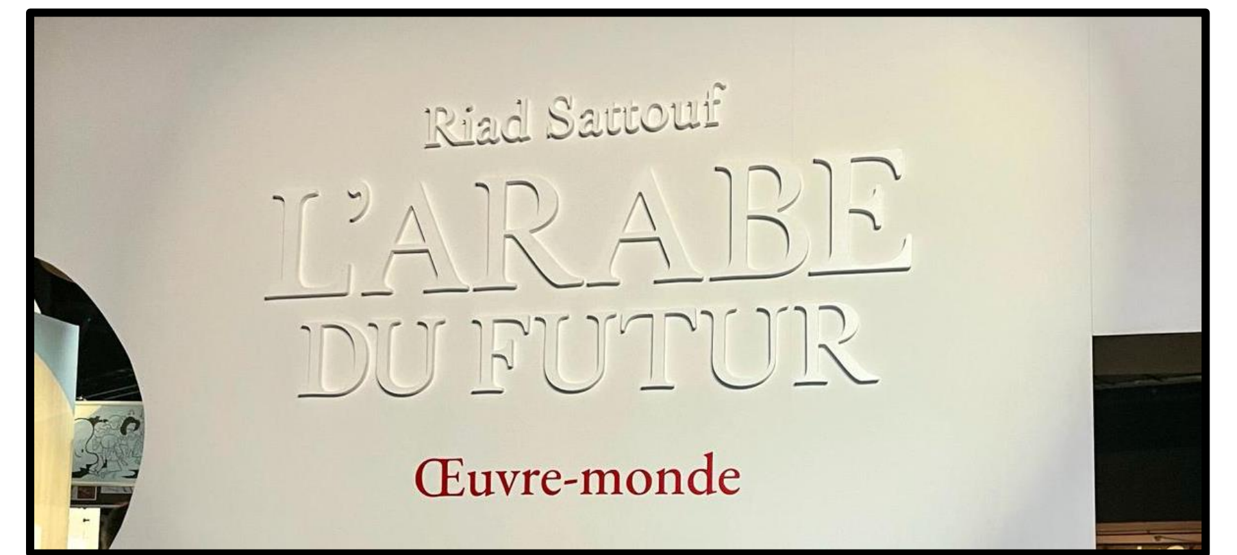
Neben vielen heures de dédicace und spannenden Ausstellungen zu großen Comic-Stars gab es auch tolle rencontres mit bekannten Autor*innen und Künstler*innen!