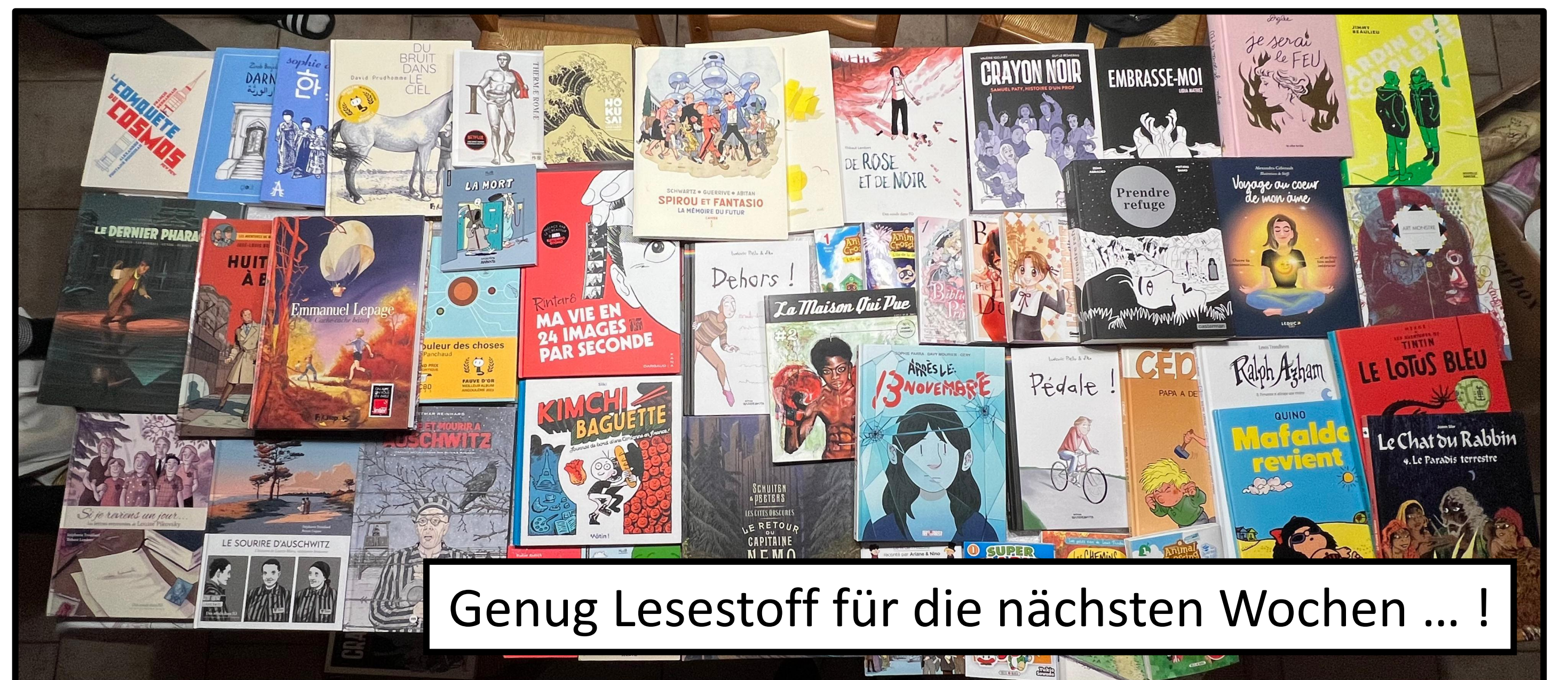
Genug Lesestoff für die nächsten Wochen ... !