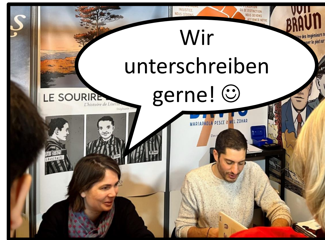
Wir unterschreiben gerne! 😊