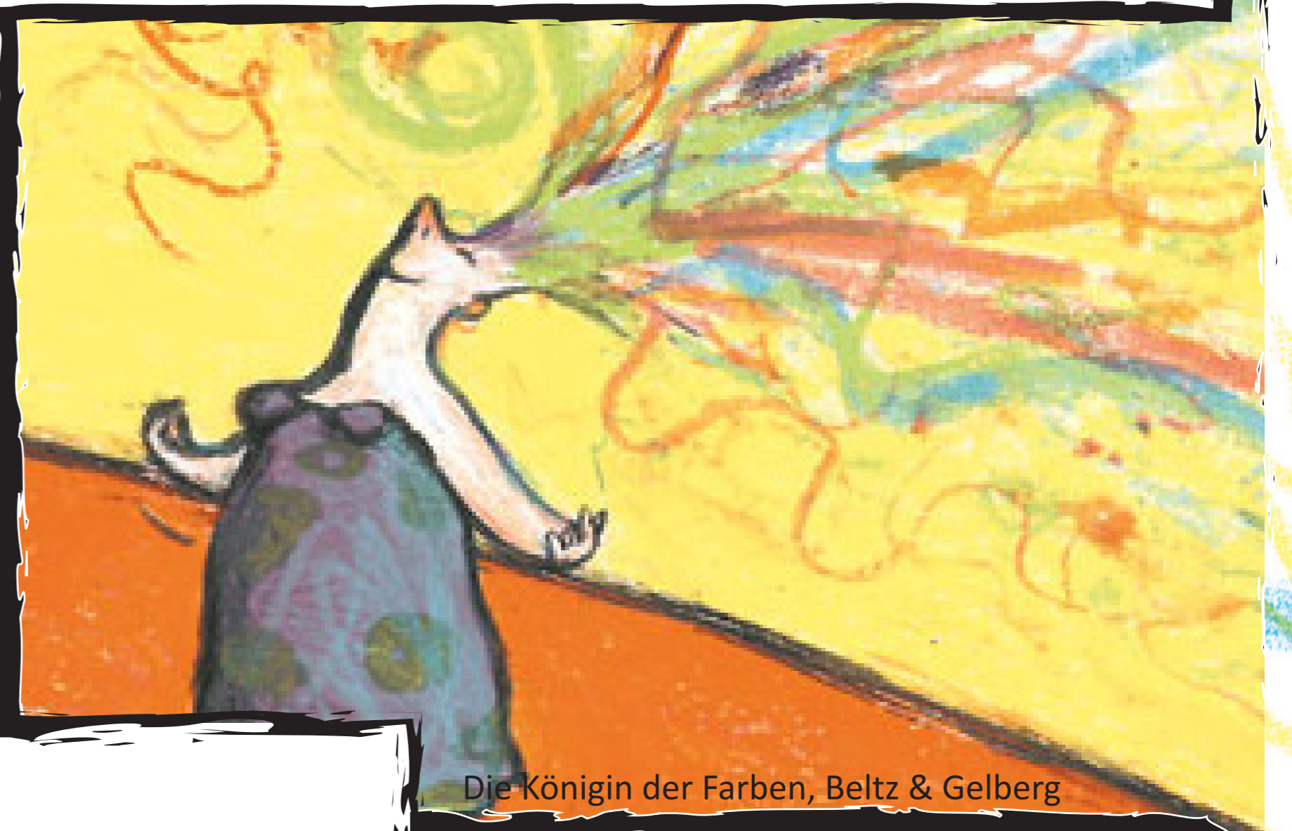
Die Königin der Farben, Beltz & Gelberg