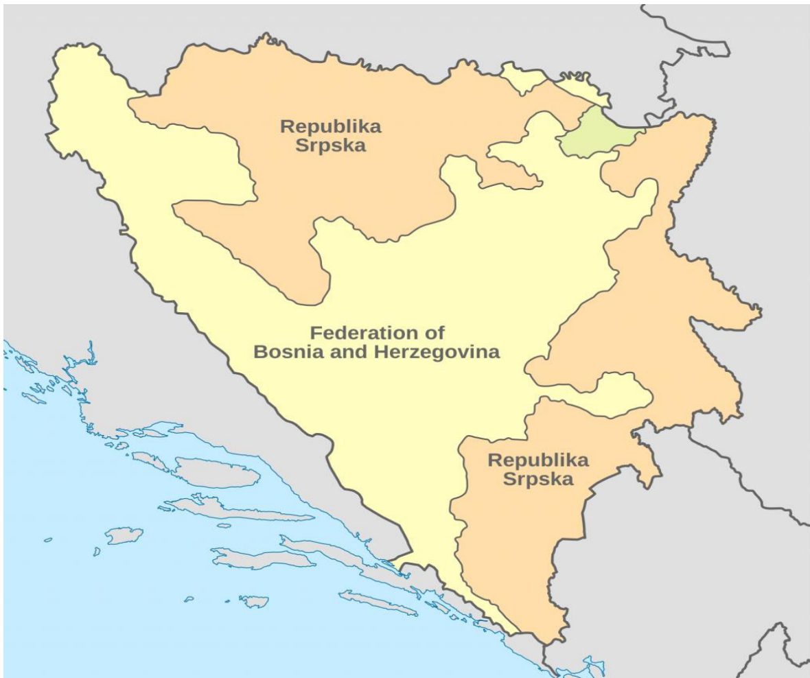
Abb. 1: Entitäten BIHs, http://react.usip.org/pub/m5/images/Bosnia-and-Herzegovina1.png (letzter Abruf: 13.03.2016)

in BIH vor dem Krieg 1991“). Die darauf folgende Volkszählung fand erst 2013, achtzehn Jahre nach dem Kriegsende statt, wobei die endgültigen Ergebnisse noch ausstehen. 10