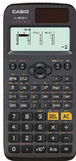
CASIO FX-85DE X