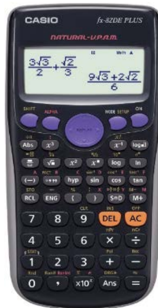
CASIO FX-82DE PLUS