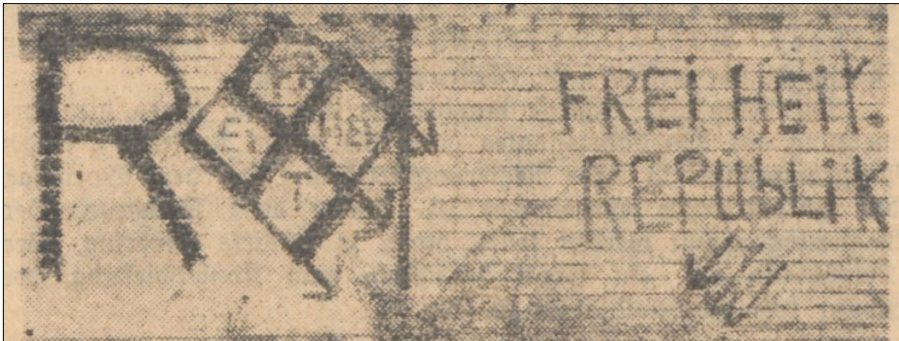
Photographie einer Mauer aus dem sozialdemokratischen Vorwärts , 29.07.1932, Friedrich-Ebert-Stiftung.

Vom 21. bis zum 23. November veranstaltet das Lab Kommunikationsgeschichte und Medienwandel (ZeMKI – Universität Bremen) eine Tagung zur prodemokratischen politischen Kommunikation der Weimarer Republik in der Staats- und Universitätsbibliothek Bremen . Einen Schwerpunkt bildet die Abwehrpropaganda gegen die NS-Kommunikation in der Endphase der Weimarer Republik. Zur Sprache kommen sowohl spezifisch kommunikationswissenschaftliche Aspekte dieser Abwehrkommunikation als auch Forschungsansätze aus benachbarten Sozialwissenschaften sowie der Geschichtswissenschaft.