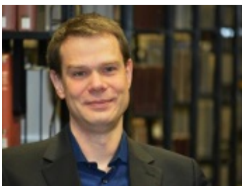
© Kai Uwe Bohn / Universität Bremen