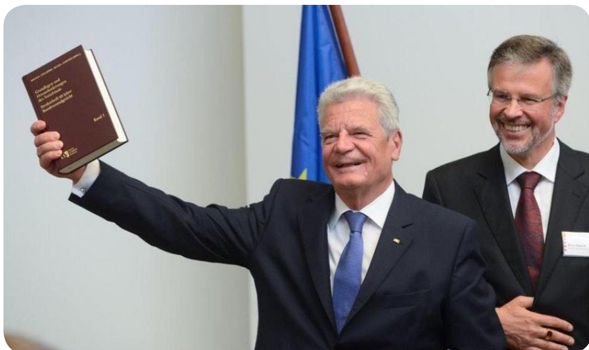
Bundespräsident Joachim Gauck mit der Sozialpolitik-Denkschrift