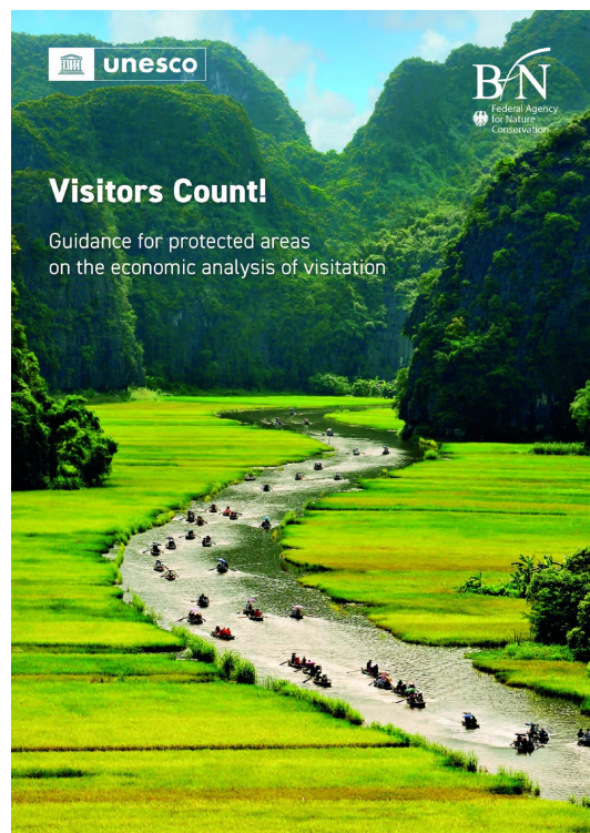
Visitors Count! Guidance for protected areas on the economic analysis of visitation

Newsletter der Deutschen UNESCO-Kommission