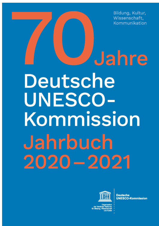
Jahrbuch der Deutschen UNESCO-Kommission 2020-2021