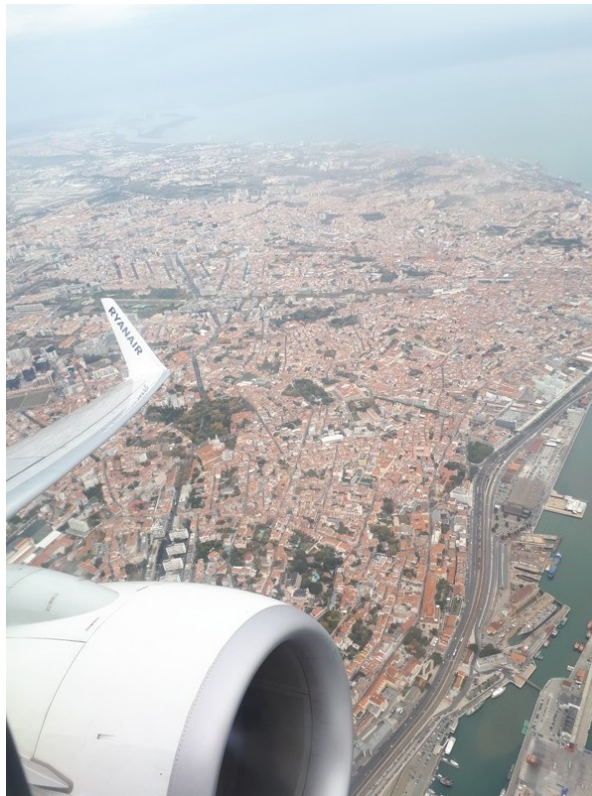
Lissabon vom Flugzeug aus