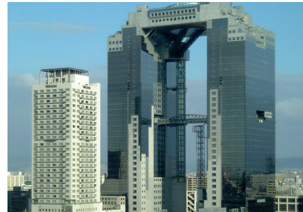
Umeda Sky Building in Osaka