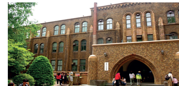
Hokkaido University: Universitätsmuseum

Bewerbung: direkt über die Hokkaido University https://hokkaidosummerinstitute.oia.hokudai.ac.jp/