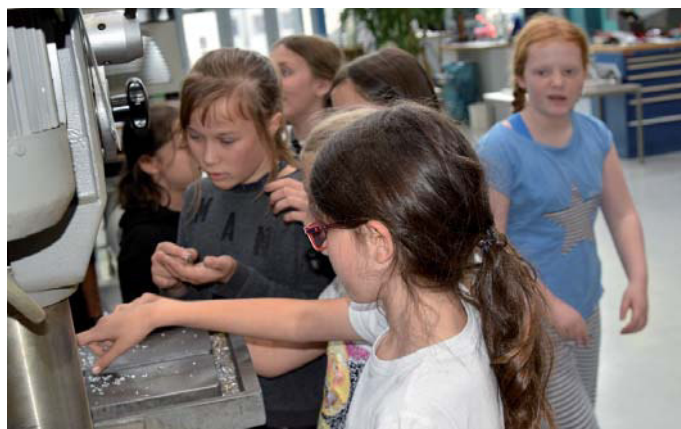
Wo geforscht wird, fallen Späne!

Im November geht es für uns weiter mit den Informatikern aus dem Sonderforschungsbereich. Die kommen zu uns und wir werden mit Arduinos das Programmieren lernen.