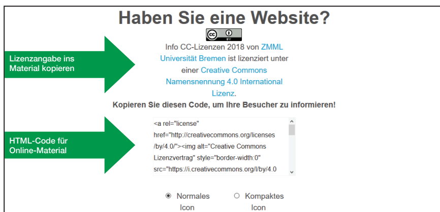
Abb. 5: Licence Chooser von Creative Commons ( creativecommons.org/choose/?lang=de ), lizenziert unter CC BY 4.0.

Die korrekte Lizenzangabe enthält: Titel des Materials + Urheber*in + Lizenzgrafik + Link zum Lizenztext + Ursprungsort Die Lizenzhinweise geben Sie gut sichtbar an, z.B. im Impressum einer Website, am Ende eines Videos bzw. an den Rändern eines Dokuments z.B. auf Folien, Skripten. Lizenzgrafiken finden Sie hier: https://creativecommons.org/about/downloads/